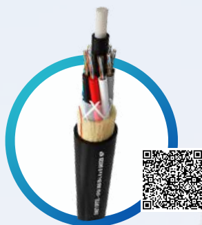
CIMET OPTEL® ADSS LIVIANO FIBRA ÓPTICA