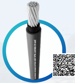
ECOPEX® BICAPA AIAI