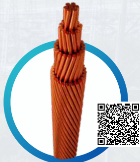
CIMET® DESNUDOS CCDLA