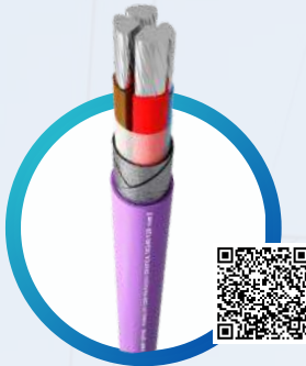
TERMOLITE® BAJA TENSIÓN