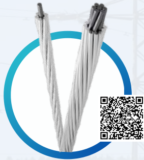
CIMET® DESNUDOS ACSR