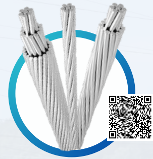
CIMET® DESNUDOS CADLA