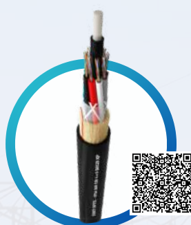
CIMET OPTEL® ADSS 120M FIBRA ÓPTICA