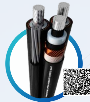
TERMOLITE® MEDIA TENSIÓN PREENSAMBLADO