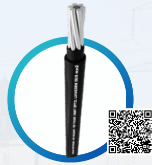
ECOPEX® BICAPA ACSR