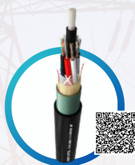
CIMET OPTEL® ARMADO FIBRA ÓPTICA