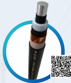
TERMOLITE® MEDIA TENSIÓN