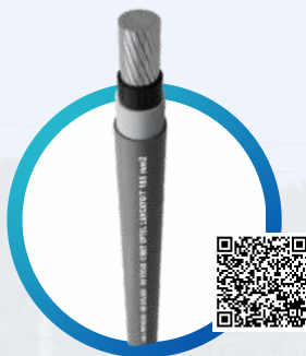
ECOPEX® TRICAPA AI