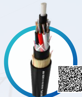
CIMET OPTEL® ADSS LARGOS FIBRA ÓPTICA