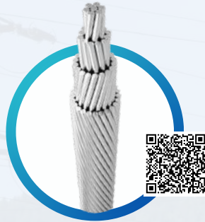
CIMET® DESNUDOS CAD